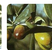
ZAČETEK BARVANJA PLODOV