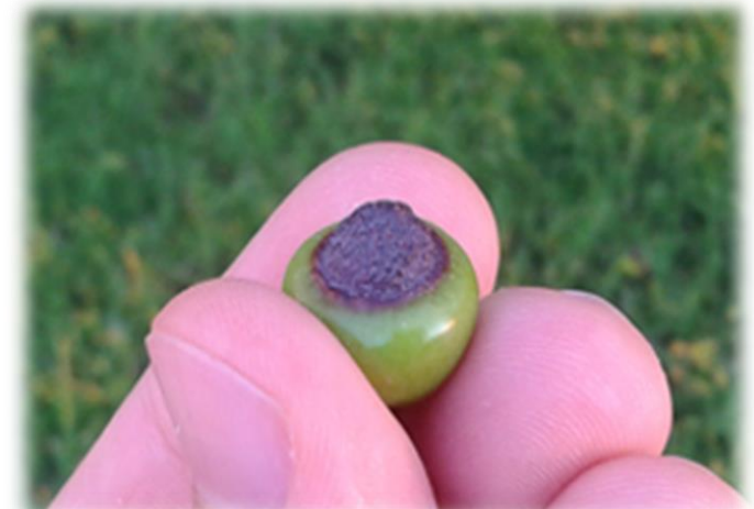
ZNAKI POMANJKANJA BORA NA PLODU