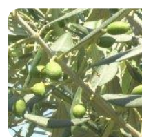
ZELENI PLODOVI OTRDIJO